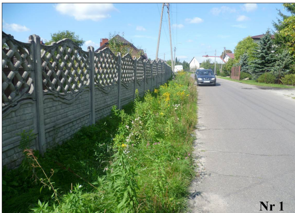
Zdjęcie nr 14 Zieleń w pasie drogi gminnej gmina wiejska Mińsk Mazowiecki