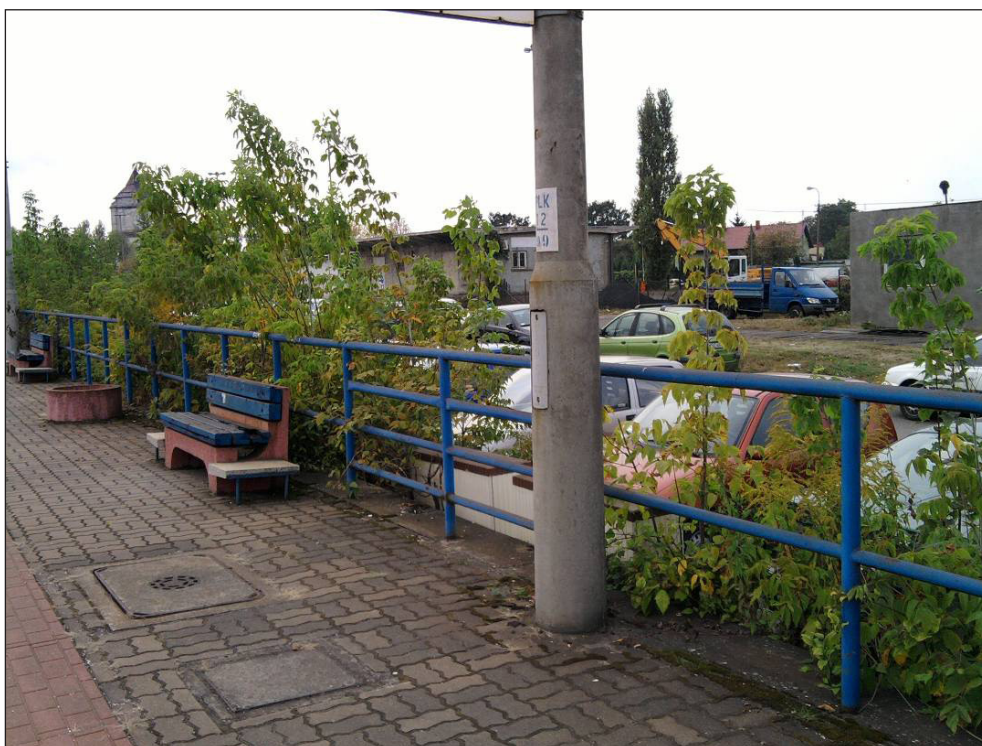
Zdjęcie nr 13 Peron stacji kolejowej Sochaczew w stronę parkingu